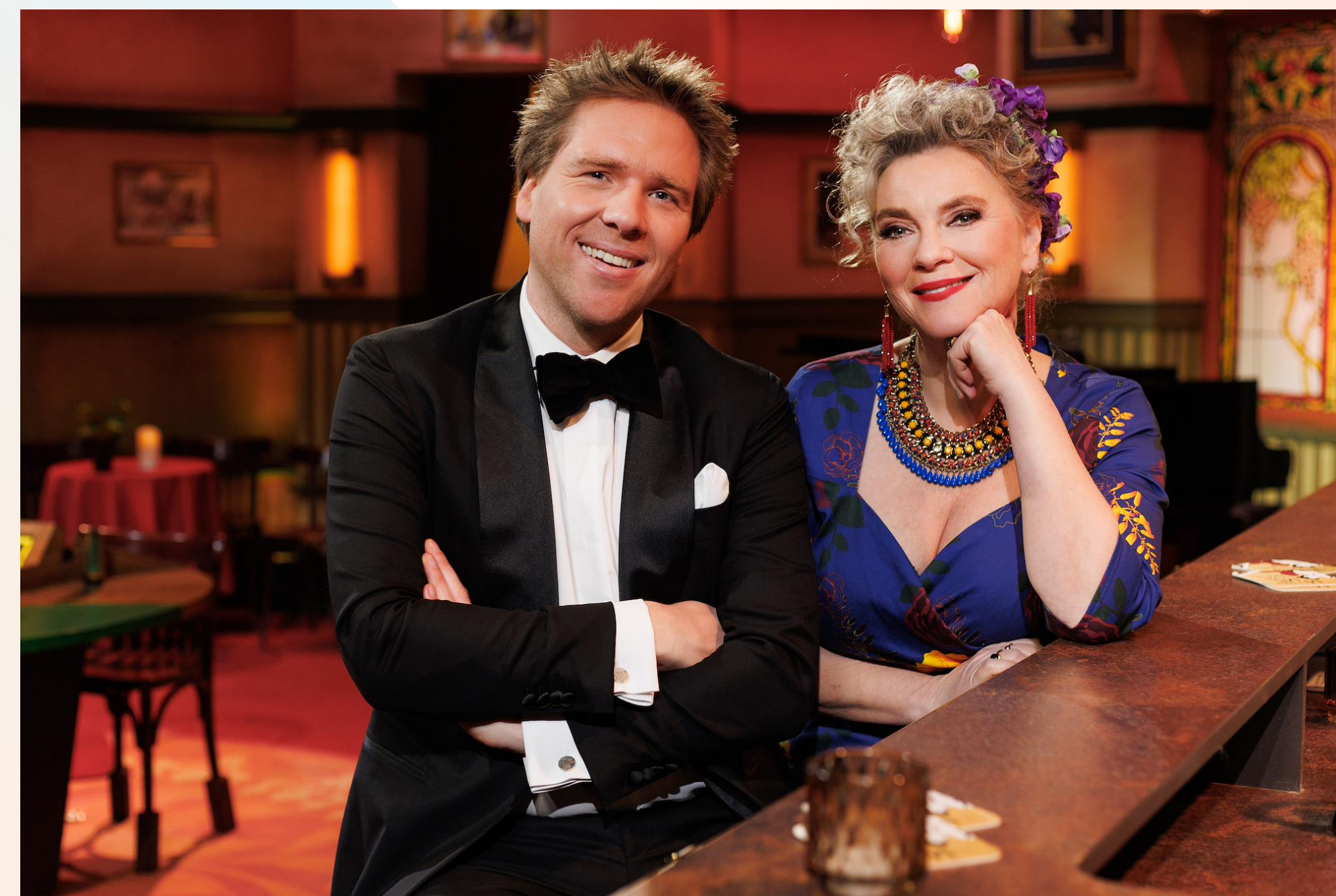
Met het Mes op Tafel (MAX)

Als publiek gefinancierde organisatie leggen wij verantwoording af over onze beleidskeuzes en over de resultaten die deze keuzes opleveren. Dat doen we in verschillende documenten. Het jaarverslag, inclusief de jaarrekening, heeft betrekking op de activiteiten van de NPO. Daarnaast publiceren we namens de gehele landelijke publieke omroep in het voorjaar de Terugblik en in september de begroting van het daaropvolgende jaar. In de Terugblik rapporteren we de resultaten van de doelstellingen uit de jaarlijkse begroting en de afspraken in de prestatieovereenkomst. Belangrijk onderdeel hiervan is de publieke waarde van onze programmering, die we door uitgebreid publieksonderzoek in kaart brengen.